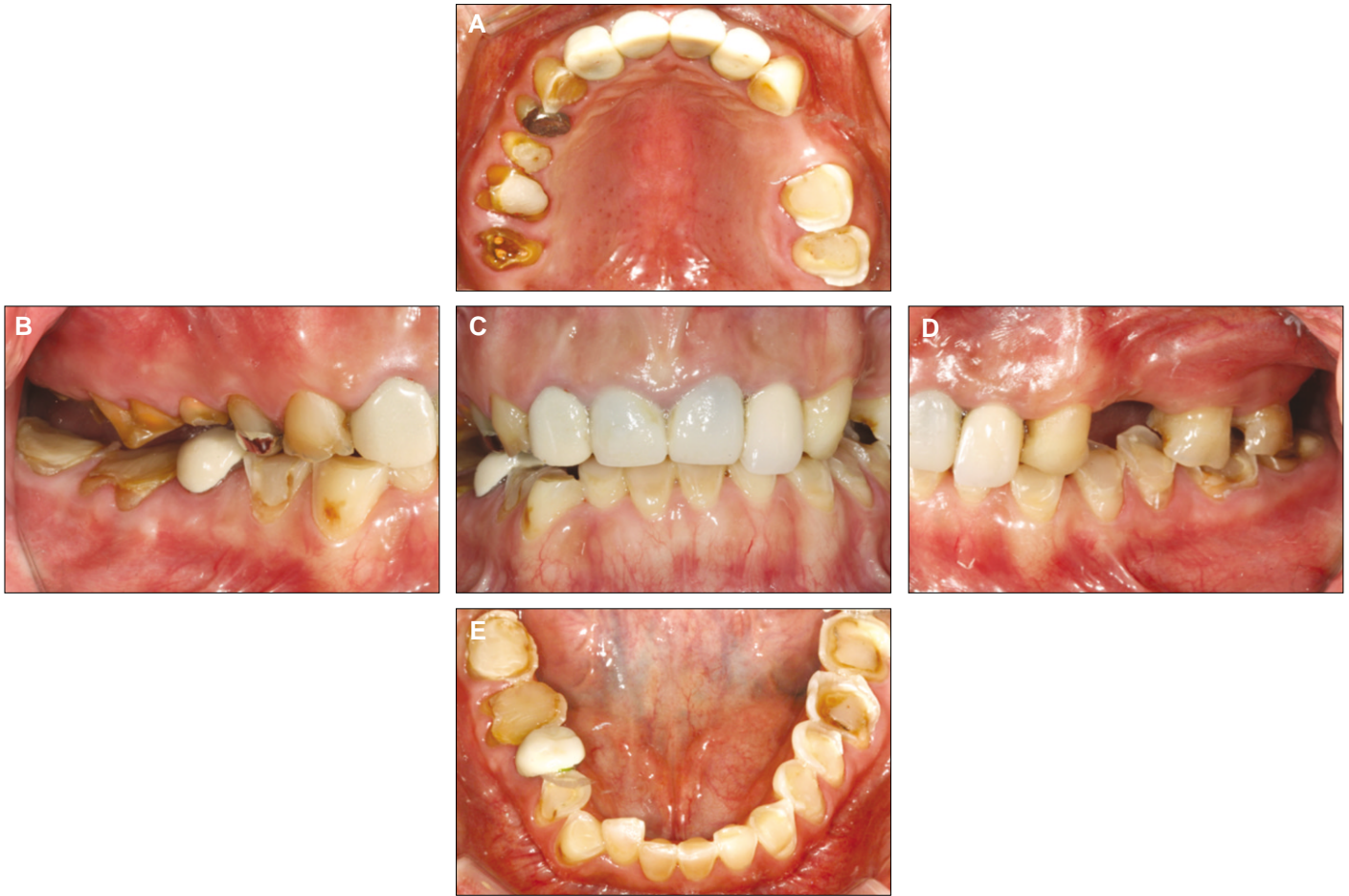
Fig. 1. Initial intraoral photographs. A: Maxillary occlusal view, B: Right buccal view, C: Frontal view, D: Left buccal view, E: Mandibular occlusal view.

한 환자의 적응력을 알아보기 위해 수직 고경의 증가는 두 번에 나눠 진행하기로 하였다. 구치부 치관연장술과 함께 전치부는 환자가 치은선의 비대칭성을 개선시키기 위해 진단 모형상에서 제작한 스텐트를 이용해 심미적 치관연장술을 시행하였다. 구치부에서 안정된 교합 접촉을 하고 측방 운동 시 견치 유도 될 수 있도록 3 mm의 수직고경 증가가 동반된 임시치아를 제작해 8주간 사용하도록 하였고 환자는 악관절 문제나 근신경계 이상을 보이지 않고 잘 적응하였다. 환자가 적응한 임시치아의 교합을 이용할 수 있도록 인상 채득해 반조절성 교합기에 마운팅하고 수직고경을 2mm 증가시켜 임시치아를 다시 제작하였다(Fig. 3). 약 8주간의 관찰 기관 동안 기능적, 심미적으로 환자는 만족하였고 특이할 만한 문제는 발견되지 않았다. 폴리비닐실록산 인상재(Imprint™ II Garant™, 3M ESPE, St Paul, USA)를 사용하여 최종인상을 채득하고 임시치아 모형과 지대치 모형을 크로스 마운팅하여 임시치아의 교합 관계를 교합기에 이전하였으며 customized incisal guide table을 통해 임시치아의 전치 유도를 기록하였다. 상하악을 금속 도재 보철물로 수복하였고 환자가 젊은 여성이라는 점을 고려해 전치부는 collarless 금속 도재 보철물로 제작하여 RMGI 시멘트(GC