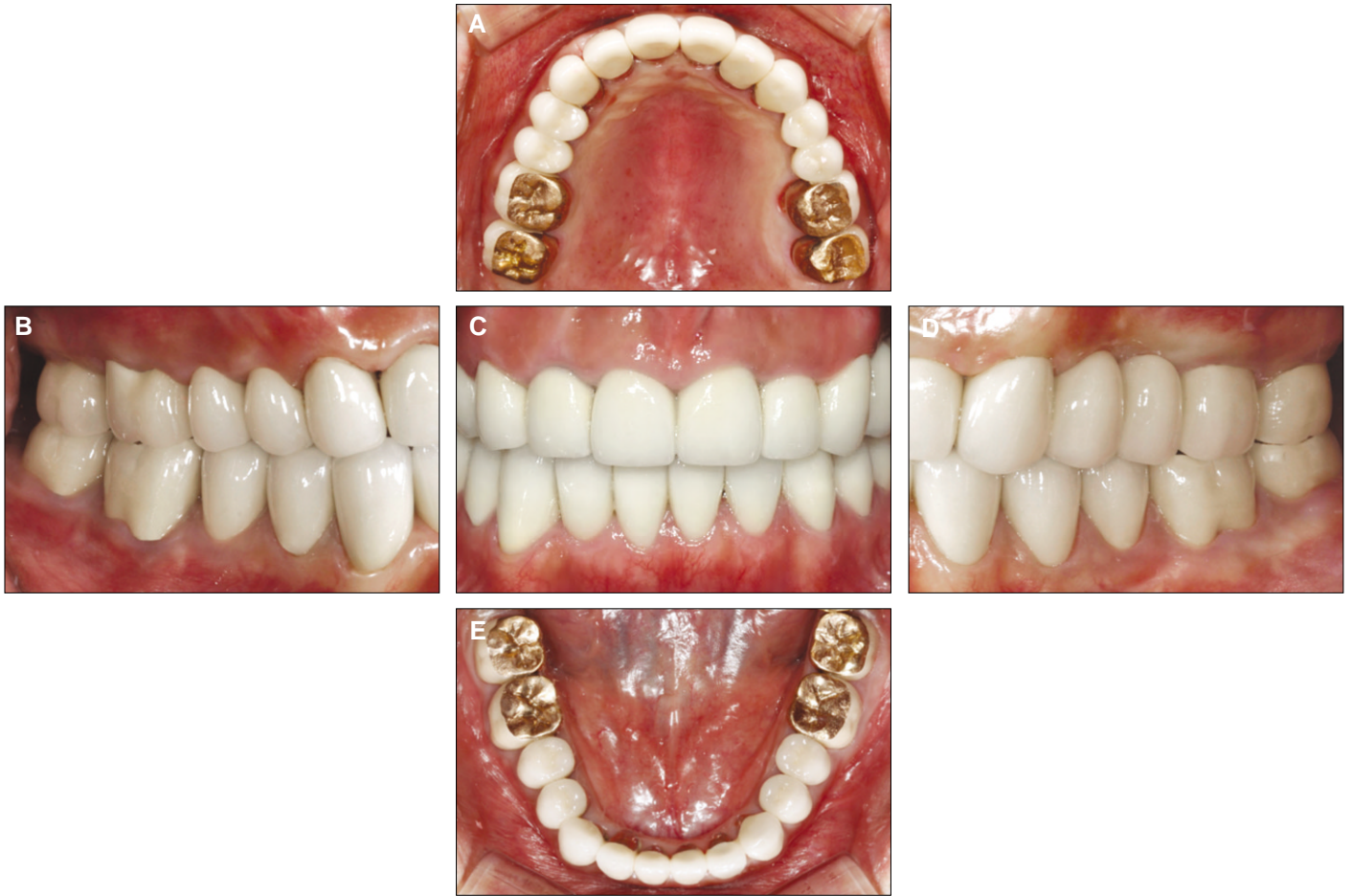
Fig. 5. Intraoral photographs of definitive restorations. A: Maxillary occlusal view, B: Right buccal view, C: Frontal view, D: Left buccal view, E: Mandibular occlusal view.