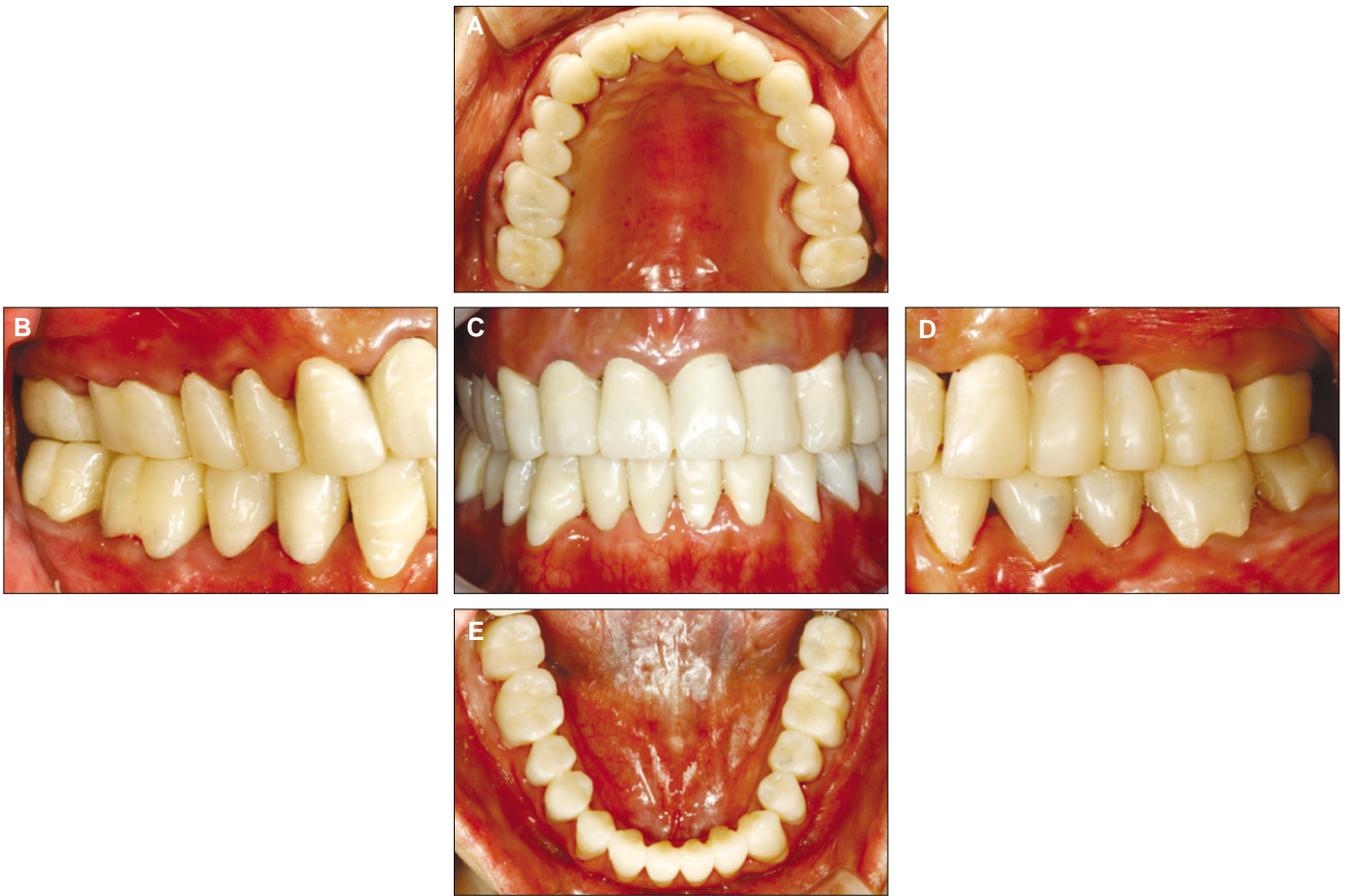
Fig. 3. Provisional restoration after increasing 5mm of occlusal vertical dimension. A: Maxillary occlusal view, B: Right buccal view, C: Frontal view, D: Left buccal view, E: Mandibular occlusal view.