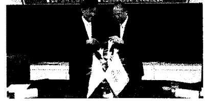
SSIF-KFPA 교류·협력 협약 체결식 * 2011. 8. 18 (목) * 학교안전공제중앙회 한국화재보험협회