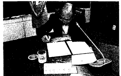
SSIF-KFPA 교류·협력 협약 체결식 * 2011. 8. 18 (목) * 학교안전공제중앙회 한국화재보험협회