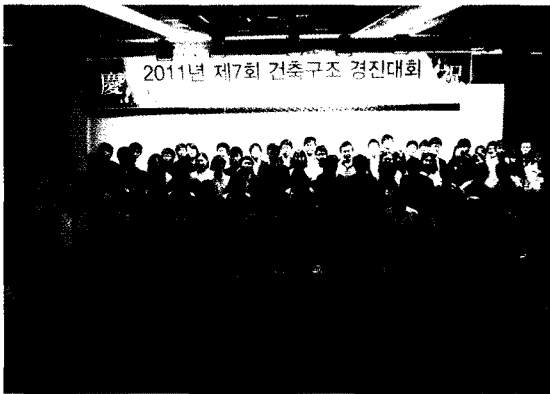
심사위원 및 수상자 단체사진