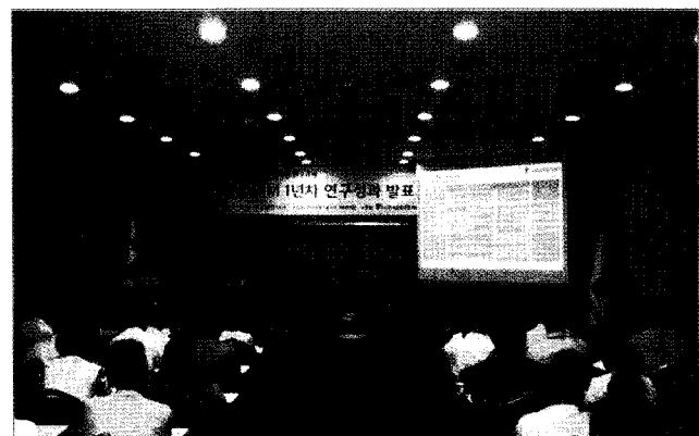
〈구조BIM 연구성과 발표〉