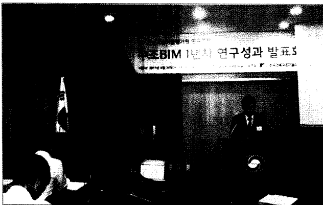
〈연구성과 발표회 개회사〉

앞으로 내년 연구에서는 실제 구조BIM 적용을 위한 테스트와 교육에 역점을 두고 연구를 진행하고자 하오니, 구조기술사 회원님, 구조교수님, 구조엔지니어들의 많은 관심과 성원을 부탁드립니다.