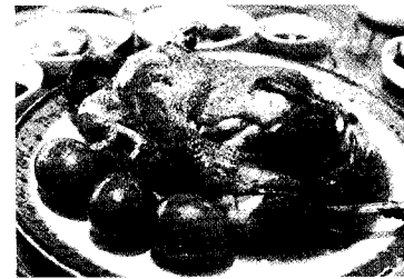
한약재와 썩향이 배어있는 썩닭백숙

썩을 듬뿍 넣어 만든 썩닭은 '동막골 가든'의 핵심 메뉴로 점심이 훌쩍 지난 시간, 비가 내리는 날임에도 원두막 정자 5~6개가 자리잡을 정도로 인기있게 만든 메뉴.