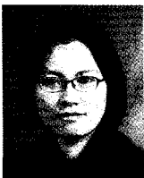
조 해 인 기자

동막골 가든은 이렇게 비가 오는 모습을 그대로 볼 수 있고 흙마당 위로 금새 빗물이 개울이 되어 흐르는 정감있는 곳이