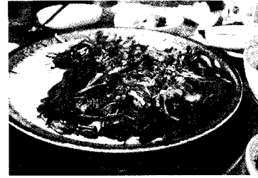
메밀가루로 반죽한 해물파전

먼저 나온 해물파전은 밀가루가 아닌 메밀가루로 반죽을 만들어 건 강을 배려했고 듬뿍 들어간 쪽파며 해물은 가격이 의심될 정도로 넉넉했다. 필자는 나오자마자 한 점을 먹고 말았는데, 그 맛을 음미하고 나서야 '아차' 하고 사진을 찍었다.