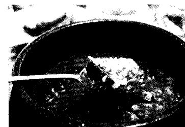
백숙을 먹고 난 후 썩닭죽도 끓여준다.

비가 내리는 중에 원두막에서 주문을 하니 우산을 쓰고 와 음식을 내려놓고 손으로 쪽쪽 뜯어 먹기 좋게 대충 발라내 주신다.