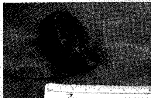
Fig. 4. The extirpated mass was round. The specimen was yellowish white in colour, soft in consistency and cystic in nature. The mass was measured 4×6×4 cm and upon sectioning, was filled with a cheesy material.