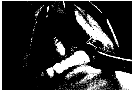
Fig. 2. Incision was designed vertically in mouth floor. Note severe elevated tongue and dome-shaped mouth floor because of huge mass.

조직학적 소견상, 섬유성 피막 내에 각화된 중층편평상피세포로 구성되어 있었으며, 이 섬유성 피막은 상피부속기, 즉 모포(hair follicle), 한선(sweat gland), 피지선(sebaceous gland)를 포함하고 있어, 유피낭종으로 확진하였다. 술후 환자는 수술일로부터 2일째 퇴원하였고, 술후 6개월 경과 후 지금까지 재발 등의 특이 소견 및 어떠한 합병증도 없이 추적 관찰 중이다.