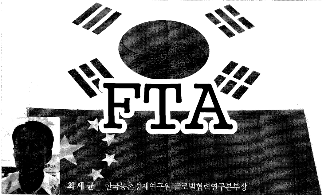
최 세 균 _ 한국농촌경제연구원 글로벌협력연구본부장

국세청의 종합소득세 자료를 보면 종합소득세 신고자(주로 자영업자) 가운데 상위 20%의 평균 소득은 9,000만원인 반면 하위 20%의 평균소득은 200만원에 불과하다. 소득차가 무려 45배에 이른다. 월급쟁이로 불리는 급여소득자들의 상위 20% 소득은 전체의 41%이고 하위 20%가 차지하는 몫은 8%에 불과하다.