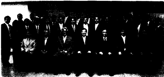
전력산업 발전과 인프라 구축을 위한 전문계고등학교(30개교) 산학협력 체결