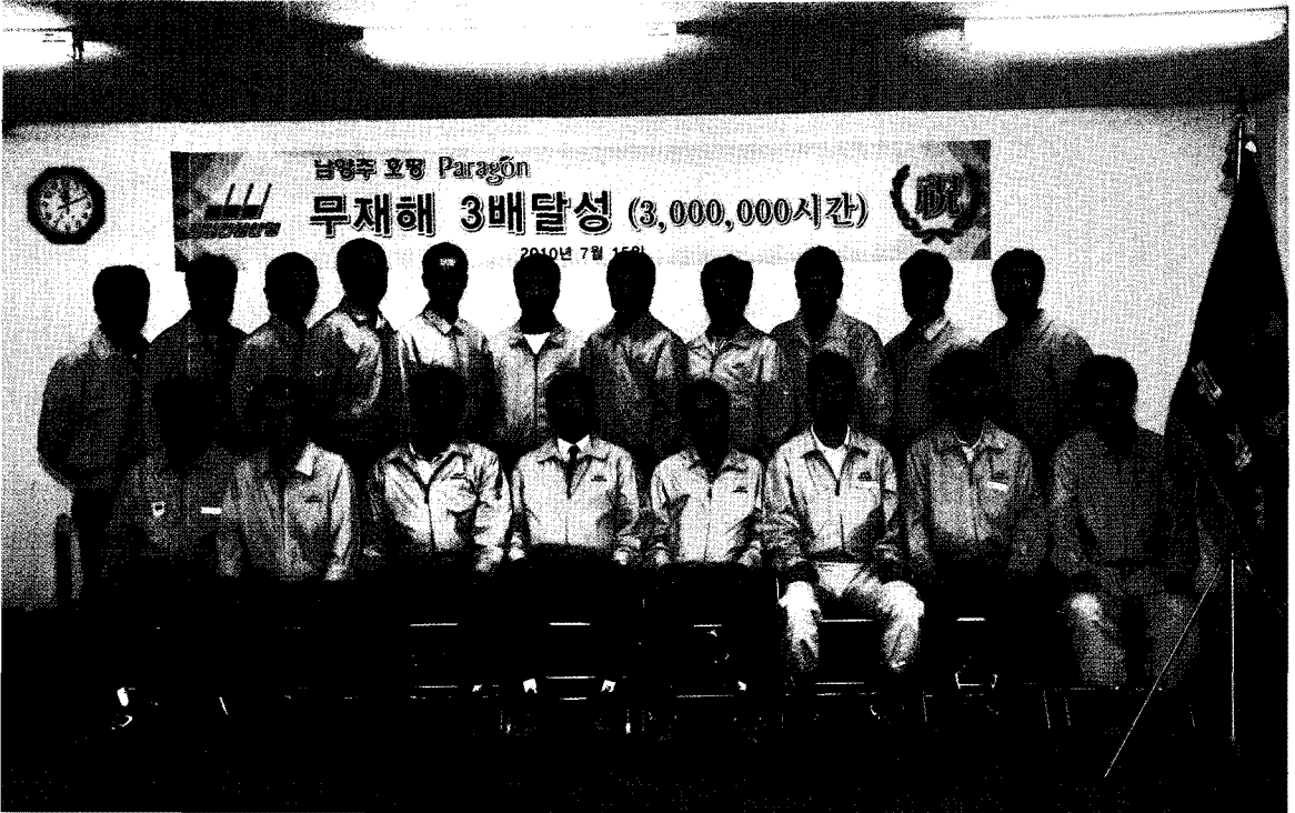
• 무재해 4백만 시간을 돌파한 호평파라곤의 주역들(무재해 3배 3백만시간 돌파 자료사진)