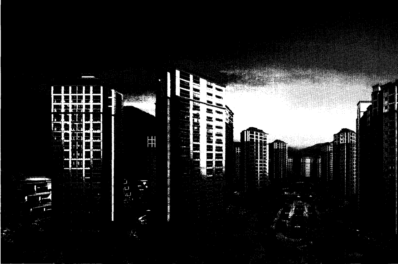
• 빠르기 보다는 바르게 성장하며 정도경영을 추구하고 있는 동양건설산업에서 시공한 남양주 호평파라곤 아파트가 무재해 4백만 시간을 돌파하며 완성되었다.