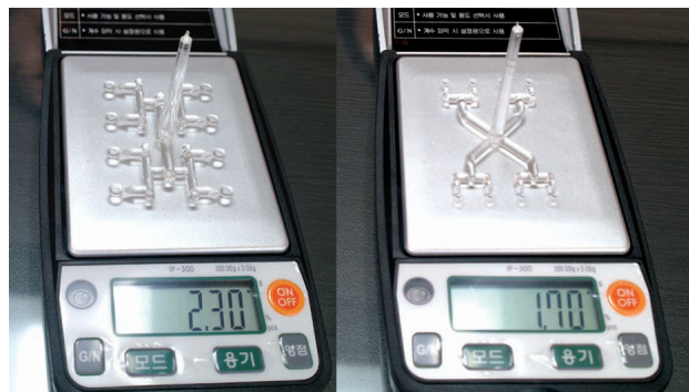
▶ 8Cavity의 경우 H자 Type의 타사제품은 사출무게가 2.3g(사진 왼쪽)인데 반해 방사형 Type의 이 회사 제품은 1.7g(사진 오른쪽)에 불과하다.

이번에 개발한 호환형의 8&16Cavity 렌즈 금형을 통해 생산효율 극대화는 물론 수지 양을 절반 가까이 줄인 것도 획기적인 성과가 아닐 수 없다. 8Cavity의 경우 H자 Type의 타사제품은 사출무게