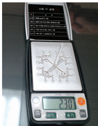
▶ 한국와이다의 16Cavity의 경우 2.3g으로 타사 대비 월등하다.

한국와이다의 모든 성과는 심혈을 기울여 개발된 수율향상 프로그램에서 출발한다. 이를 통해 각 렌즈의 진원도 확보, Cavity별 외경 및 형상편차 최소화 등과 함께 가장 중요한 각 면의 decenter(광 중심축)량 관리, 면간(S1, S2면) decenter량을 최소화 시키는 금형구조 설계, 금형 보정기술의 개발 등이 어우러진 결과로 회사 측은 보고, 앞으로 이 기술들을 더욱 보완·발전시켜 초정밀 금형의 메