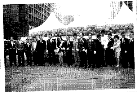
▲ 올해로 8회째 육우데이 기념식을 맞이해 본격적인 육우소비 촉진 활동 전개를 알리는 테이핑 커팅 순간

이번 행사는 TV를 통한 사전고지 및 방송, SBS라디오(파워FM)에서는 6월9일 당일 전 프로그램(07:00~24:00)을 통한 육우알리기 홍보, 온라인 파워블로거 마케팅 등 전 매체를 아우르는 종합홍보를 통하여 국내산 육우를 전국적으로 알리는 기회가 되었다.