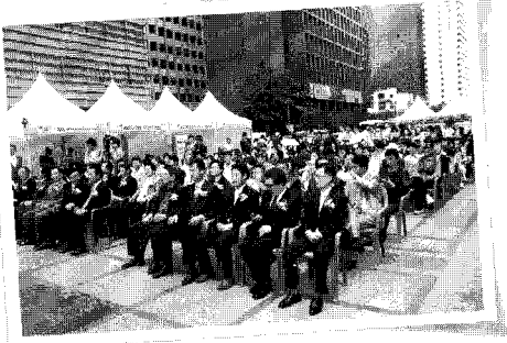
▲ 행사장 전경