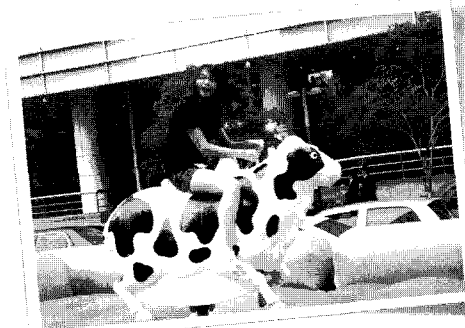
▲ 로데오를 즐기는 여고생

협회 이승호 회장은 “맛, 안전성, 경제성 3박자를 갖춘 우리 육우도 알리고, 농가와 시민들이 어우러지는 뜻 깊은 행사를 마련할 수 있게 되어 기쁘다.”고 밝히며, “현재 육우가격 폭락으로 육우사육농가가 큰 어려움에 직면하고 있는 상황에서 앞으로 우수한 품질의 실속있는 우리 육우고기가 소비자들의 더 큰 관심과 사랑을 받을 수 있도록 육우고기 우수성 홍보에 적극 앞장서겠다.”고 덧붙였다. ☺