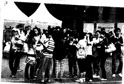
▲ 외국인들도 행사장을 방문하였다