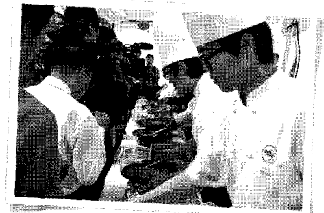
▲ 이번에도 시민들에게 제공된 육우고기