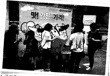
▲ 포토존에서의 시민들