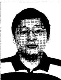
작가 | 신현배

“세상을 만들었지만 살아 움직이는 것이 없어서 너무 고요하고 쓸쓸하구나. 사람과 동물들을 만들어야겠다.”