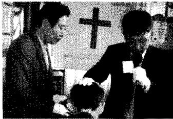
축하드려요. 성부, 성자, 성령의 이름으로..(환우 병상세례)