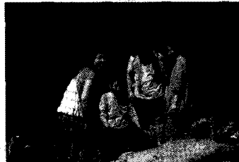
계곡으로 나들이 간 환우와 봉사자