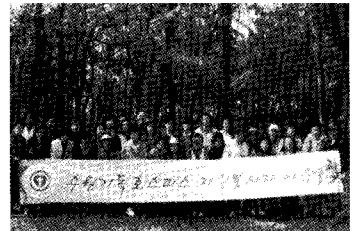
함께 웃어봐요^^(자원봉사자 아우회)