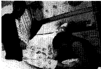
주님의 마음을 본받는 자(세족식)