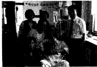
세례 후 가족과 함께