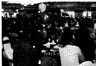
호스피스 사랑 일일차집