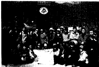
호봉회 속리산 등반