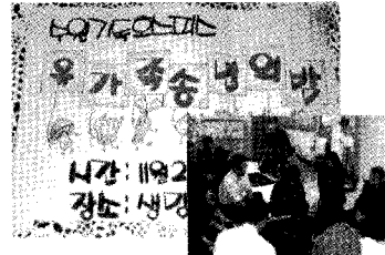
송년의 밤(한사랑회 유가족 모임)