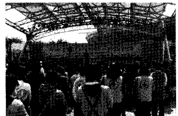
호스피스 사랑바자회 개장 감사예배