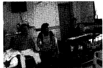
노래하는 곳에 사랑이 있고.. (병동 음악치유프로그램)