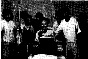
내 생애 최고의 생일파티