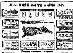
〈최고기 육질등급 표시 방법 및 부위별 안내도〉

축산물품질평가원은 다양한 홍보방법을 통해 소비자에게 다가가고자 홍보용 영상물, 홍보 UCC, 쇠고기를 맛있게 먹는 법(책자), 쇠고기 육질등급 표시 방법 및 부위별 안내도(포스터) 등을 제작하여 배부·등재하였다.