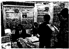
〈취업준비성과 상담 중〉

축산물품질평가원은 임직원이 모금을 통해 마련한 사회공헌 활동기금을 활용하여 사랑나눔 봉사활동을 실천하였다. 지난해 12월 28일(화) 군포시를 방문하여 매월 급여의 일정액을 공제하여 마련한 일천만원의 사랑의 성금으로 기탁하였으며 29일(수)에는 서울 종로구에 소재한 재단법인 한국백혈병어린이재단과 지난 1년 동안 직원들이 모은 헌혈증(200장) 및 모금액을 기부하는 기부약정을 체결하였다. 또한 10개 지원에서도 1지원 1후원 사회공헌활동을 통해 결연을 맺은 노인 및 중증장애인 요양시설 등에 소정의 성금을 기탁하였다.