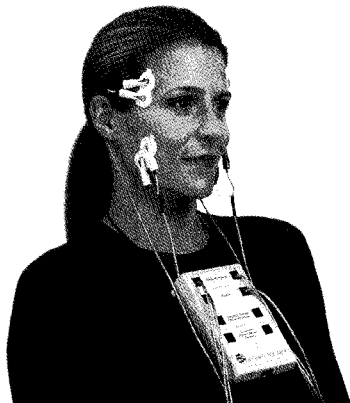
그림 6. Jaw muscle electromyography(EMG) device : K7/EMG (Myotronics Noromed Inc., Seattle, WA)

전극을 피부 표면이나 근육 내에 삽입하여 근육의 electrical potential을 그래프로 기록하는 장비로 1950년대부터 치과분야에 사용되기 시작하였고 측두하악장애의 진단과 치료 및 치료의 전후 결과를 비교하여 그 효과를 객관적으로 연구하는데 적용되어 왔다 (그림 6).