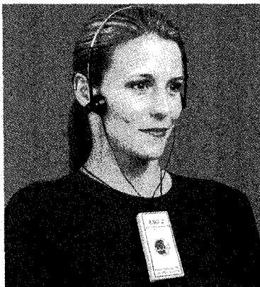
그림 1. TMJ vibration(sound) system : K7/ESG(Electrosonograph) (Myotronics Inc., Seattle, WA)

보철물 제작 시 보철물이 대합치아와 조화롭게 접촉하고 있는지, 과도한 교합력으로 인한 무리한 힘이 가해지고 있지는 않은지 등을 확인해야 하며, 주로 치아의 마모면이나 fremitus, 치아 동요도, 교합지 등을 사용하여 임상적으로 검사하게 된다. 그러나 특정한