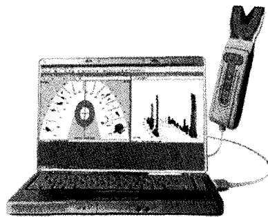
그림 2. T-scan system : T-Scan III (Tekscan Inc., Boston, MA)

이 장비 역시 교합 접촉점의 위치와 교합력을 기록하는 것으로 일정 압력 이상의 힘이 가해지면 필름내의 마이크로 캡슐이 깨지면서 염료가 외부 현상액과 반응하여 접촉점에 붉은색의 마크를 남기게 되며, 압력이 높을수록 진하게 표시된다. 그러나 센서가 너무