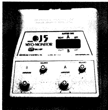
그림 5. Jaw muscle stimulation device : J5 Myomonitor TENS unit (Myotronics Noromed Inc., Seattle, WA)