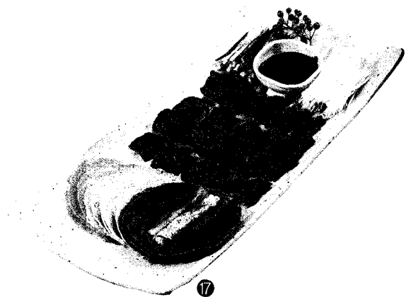
14 오향수육 15 비즈니스 A코스 16 배나무골 B코스 17 서울덕(겉절이)

배나무골이 지난 20년간 소비자들에게 많은 사랑을 받아온 것은 이 같은 장 대표의 믿음이 있었기에 가능했을 것으로 보인다. 때문에 오리기업 중에서도 (주)이목원이 특히 기대되는 이유이기도 하다.