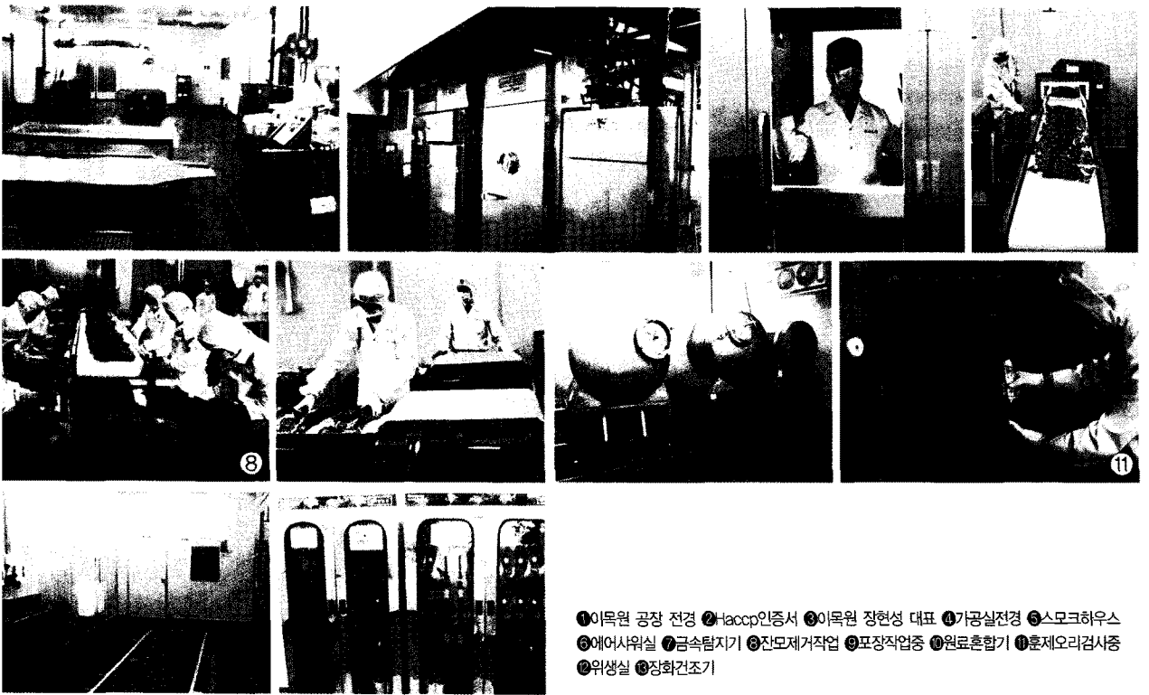
①이목원 공장 전경 ②Haccp인증서 ③이목원 정현성 대표 ④가공실전경 ⑤스모크하우스 ⑥에어샤워실 ⑦금속탐지기 ⑧잔오제거작업 ⑨포장작업중 ⑩원료혼합기 ⑪훈제오리검사중 ⑫위생실 ⑬장화건조기

뿐만 아니라 경기도 안성에 중앙집중식주방(CK, central kitchen)을 운영하고 있어 배나무골 등에 한결 같은 음식 맛을 제공하고 있다.