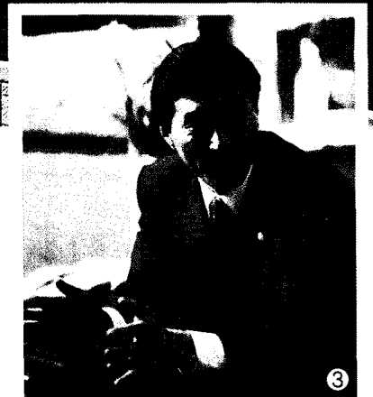
글, 사진 : 축산신문 이희영 기자