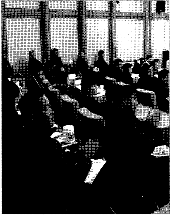
2010년 들어 가장 추운 날이었음에도 불구하고 이날 토론회에는 200여명의 관계자들이 참석해 육계 계열화 사업에 대한 높은 관심을 나타냈다.

특히 하림은 닭고기 생산, 가공, 유통, 판매의 전 과정이 계열주체에 의해 통합 관리되고 지속적인 연구개발, 품질관리 활동을 통해 최종 소비제품의 위생 안전과 품질 향상이 이뤄지고 있다. 또한 소비형태 변화와 요구에 따른 제품 다양화 등으로 750종의 닭고기 제품을 개발하기도 했다.