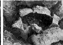
▲ 배추 석회결핍증