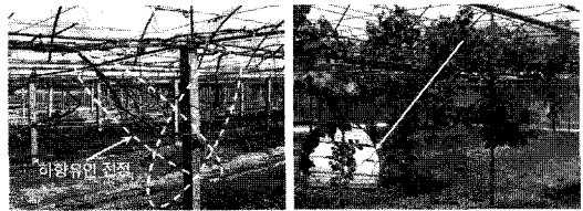
〈그림2〉 거봉품종 동계전정 시 하향유인전정(왼쪽)과 개화기 착과 모습(오른쪽)

시키므로 원칙적으로 잘라주어야 하지만, 강하게 성장된 가지를 솎음전정 또는 가지의 중간부분에서 절단전정을 하면 남겨진 눈 수가 적게 된다. 그러므로 강하게 성장하는 가지는 수세 조절용으로 포도나무 아래쪽으로 하향유인시키고, 착립이 확인되면 세력을 보아가면서 잘라준다<그림2>. ㉔