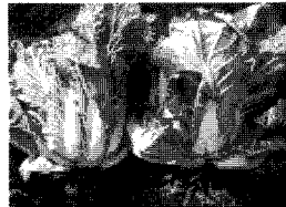
▲ 배추 뿌리혹병