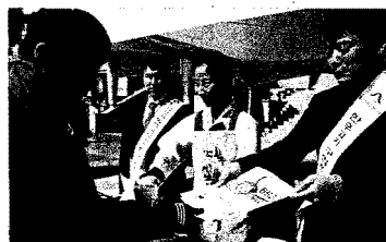
(등급제 및 이력제 홍보)

축산물품질평가원에서는 지난 3월 10일 서울 용산 아이파크몰 광장에서 열린 '한우사랑 한마음 시사회'에 참가하여 구제역의 인체 무해성을 알리고 어려움에 처한 한우농가에 희망의 메시지를 전달하면서 축산물등급제 및 쇠고기 이력제도 함께 홍보하였다.