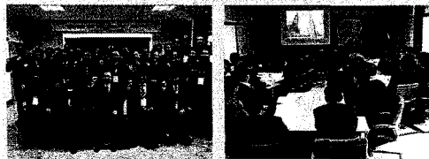
(최형규 원장과 함께)