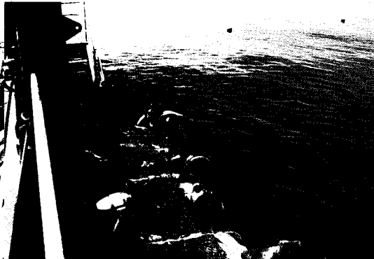
산호군락에 위치한 해양 테라스

험 등이 있다. 이들 중 대보초 크루즈와 열대우림과 쿠란다 마을을 체험하였다.