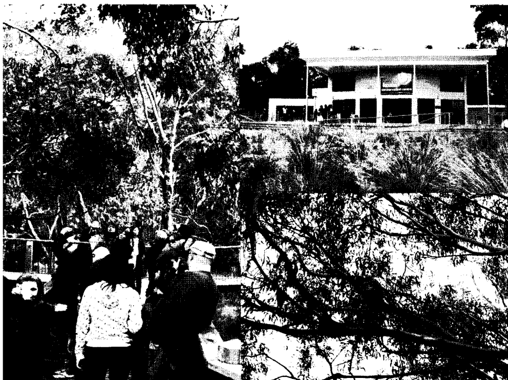
i 코알라를 관찰하는 탐방객 ii, iii 코알라 보전센터 전경과 휴식중인 코알라

펭귄 프레이드는 필립섬의 서쪽 끝지역에서 번식하는 펭귄무리들이 낮시간 동안 먹이를 먹은 후 저녁 해질녘에 해안가에 오른 후 보래사장을 건너 언덕에 파놓은 굴 속의 둥지로 돌아가는 수 백마리의 펭귄들을 가까이서 직접 관찰하는 상품으로 '프레이드'라는 명칭에 어울리게 끊임없이 줄지어 가는 모습을 볼 수 있다. 프레이드는 약 50분 동안 계속되며 탐방객들은 해안가에 위치한 관람석과 언덕에 자리잡은 데크 등 야외에서 펭귄들을 직접 관찰하게 된다. 방문자센터와 해변의 관람석 그리고 관찰데크, 주차장 외 시설물은 간소화 하였으며 정해진 경로 이외에는 대부분 출입을 봉쇄하고 있었다. 특히 방문자 센터 이외의 지역에서는 사진촬영이 엄격히 금지되어 있었으며 곳곳에 배치된 자원봉사자와 레인저들이 통제를 담당하고 있었다. 한때 많은 탐방객으로 인해 펭귄의 개체수가 많이 줄어든 뉴질랜드 샌드플라이(Sandfly)와는 다르게 이 지역은 '필립섬 자연공원 관리위원회'에 의해 서식지 관리 시스템을 통한 체계적인 관리가 이뤄지고 있었다. 위원회는 자치기관으로서 펭귄 개체군에 대한 연구활동 뿐 만 아니라 교육 및 보호활동도 실시하고 있었다. 입장료와 기념품 판매를 통한 수익금은 필립섬 야생동물의 보전에 이용된다고 한다.