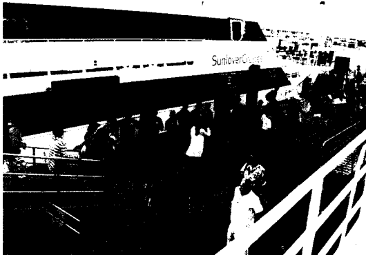
썬러버 크루즈에서 운항 중인 쾌속선