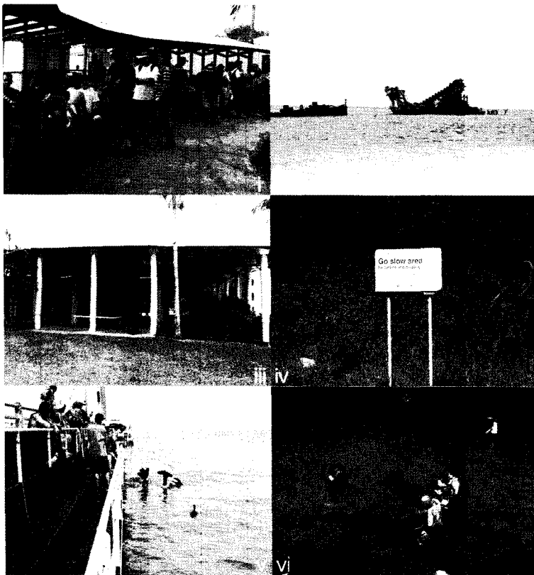
i 항구에서 페리를 기다리는 관광객 iii 포획한 고래를 해체하고 보관하던 창고 v 펠리칸 먹이 주기

탕갈루마리조트는 생태체험과 휴양 그리고 액티비티가 어우러진 공간으로 다양한 체험프로그램이 운영 중이었