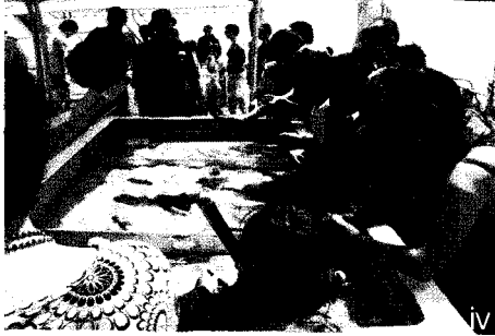
i 선택 관광 중 하나인 체험다이빙 ii 반잠수정 내부 전경 iii 물고기와 함께 하는 스노우클링 iv 해양 생물 체험용 수족관

열대 산호 속 다양한 물고기를 보고 바다 속을 헤엄쳐 다닌다는 흥미로운 체험으로 많은 감동을 받았지만 몇 가지 아쉬거나 부족한 부분이 있었다. 먼저 산호 군락에 머무는 4시간 동안 점심 식사와 체험 다이빙, 반잠수정 체험과 스노클링은 체험 할 수 있었지만 그 외의 프로그램을 참여하기에는 시간이 너무나 부족하였다. 또한 산호 보호를 위해 노력은 하고 있었지만 오랜 기간 많은 사람이 찾는 관계로 알려진 바와는 다르게 산호 군락은 많이 훼손되어 있었다. 무엇보다 아쉬웠던 점은 한정된 스노클링 장비를 여러 사람이 함께 사용하지만 세척없이 그대로 다음 사람이 사용해야함으로 비위생적인 관리가 주는 불편감이었다. 해양생물에 대한 강의가 있기는 했지만 터미널과 산호군락 간 긴 이동시간 동안 지루함을 채우기에는 부족했다.