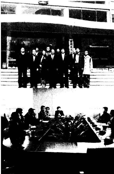
〈심천시청과 경제특구 관계자 인터뷰 모습〉

셋째, 심천시는 경제특구가 중국 본토 내 대학의 테스트베드(Testbed) 역할을 담당하게 하고, 홍콩대학의 R&D 기능을 기업체에 연결해 주고 있다. 심천시는 기업이 연구개발환경을 조성하는데 적극적으로 지원하여 혁신인재규모는 날로 방대해지고 인재구조도 갈수록 최적화되었다 2) . 심천시의 인재규모는 2009년 말 336만 명으로 그 중 전문기술인재는 98만6천만 명이다. 심천시에 서 승인한 112만 9천만 명의 첨단기술기업 종사자 중에서 연구개발에 종사하는 과학기술요원은 약 25만 명(박사 4,000명, 석사는 73,000명)에 달한다.