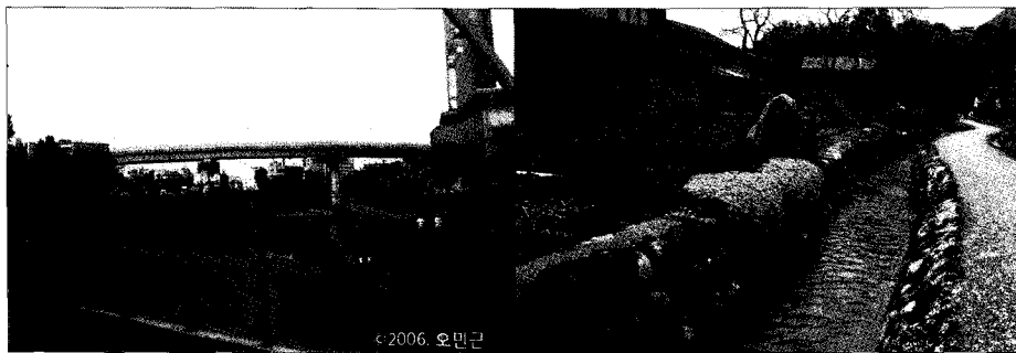
청계천 풍경(왼쪽) 및 일본 시라카와 마을내 실개천(오른쪽)

게 되어 지역활성화에 활용할 수 있는 새로운 가치자원으로 다루어지게 되기도 한다.