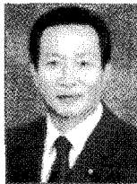
(주)새물종합 건축사사무소 한양대학교 건축공학과 전 대한건축사협회 이사 현 한국도시시설공단 옹지매수대책위원회 위원