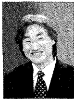
이사 조중기 건축사사무소 간향 홍익대학교 대학원 (주)창우정 종합건축사사무소 근무 전 대한건축사협회 이사 (법제위원장)