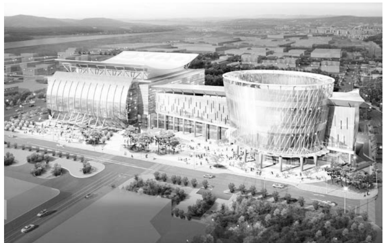
▲ 박람회가 개최될 대구 EXCO 전경