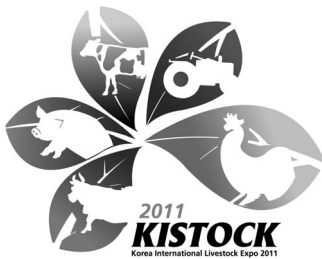
▲ 축산박람회 엠블렘

이번 개최지로 결정된 대구행사장은 전국의 어느 곳에서도 축산인들이 쉽게 찾아올 수 있도록 동대구역에서 15분 거리에 자리를