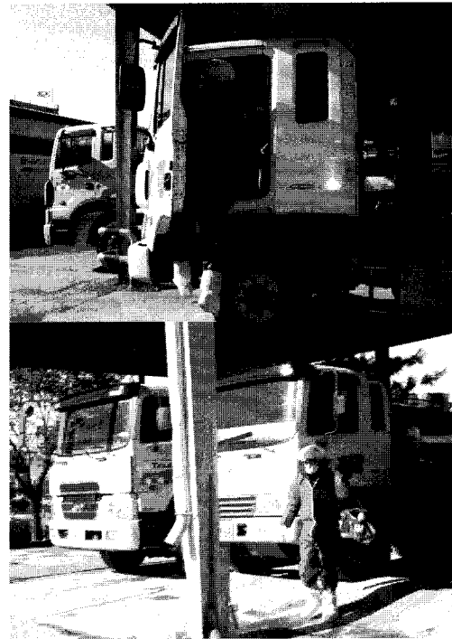
▲ 하차 전후 운전석 주변과 개인소독에 유의한다

혹한의 날씨에 불구하고 잇달아 확산되는 구제역사태에 어디든 긴장속 분주히 구제역 차단방역에 힘을 쏟는 모습이다. 곳곳의 방역인원들이 뽀얀 입김 내쉬며 방역에 여념이 없는 모습들에 더 이상 무너질 수 없다는 강한 의지가 역력하다.