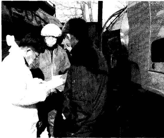
▲ 집유장 방역실태를 점검 중인 모습