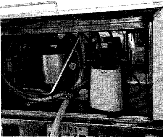
▲ 집유차량에는 여러 종의 소독기를 비치하고 있다