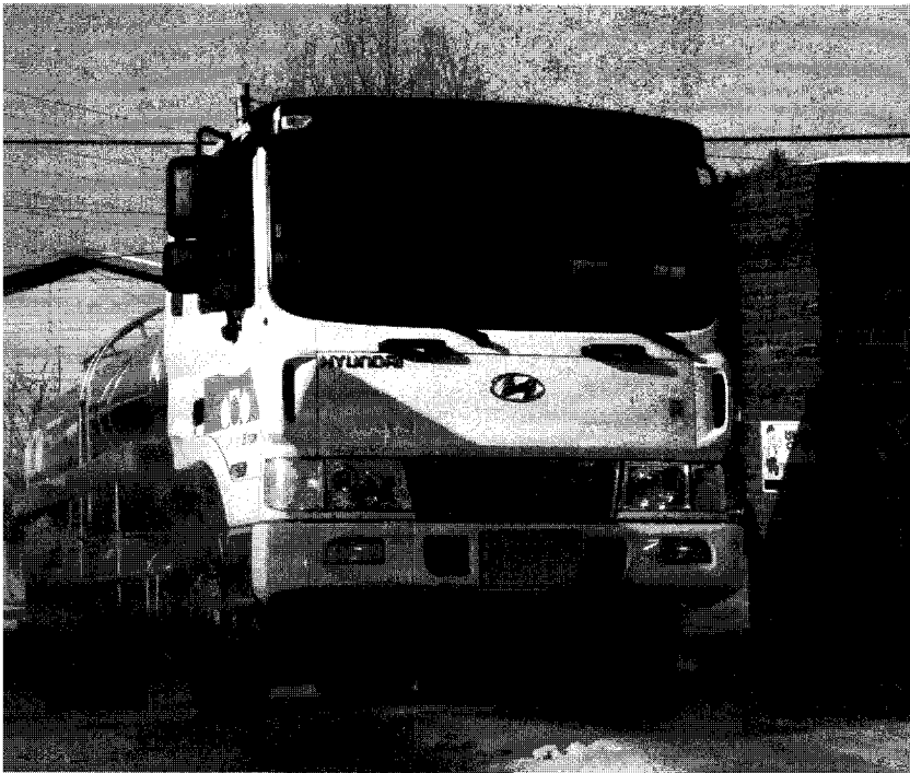
▲ 집유장 입구를 통과하는 집유차량이 소독을 거치고 있다