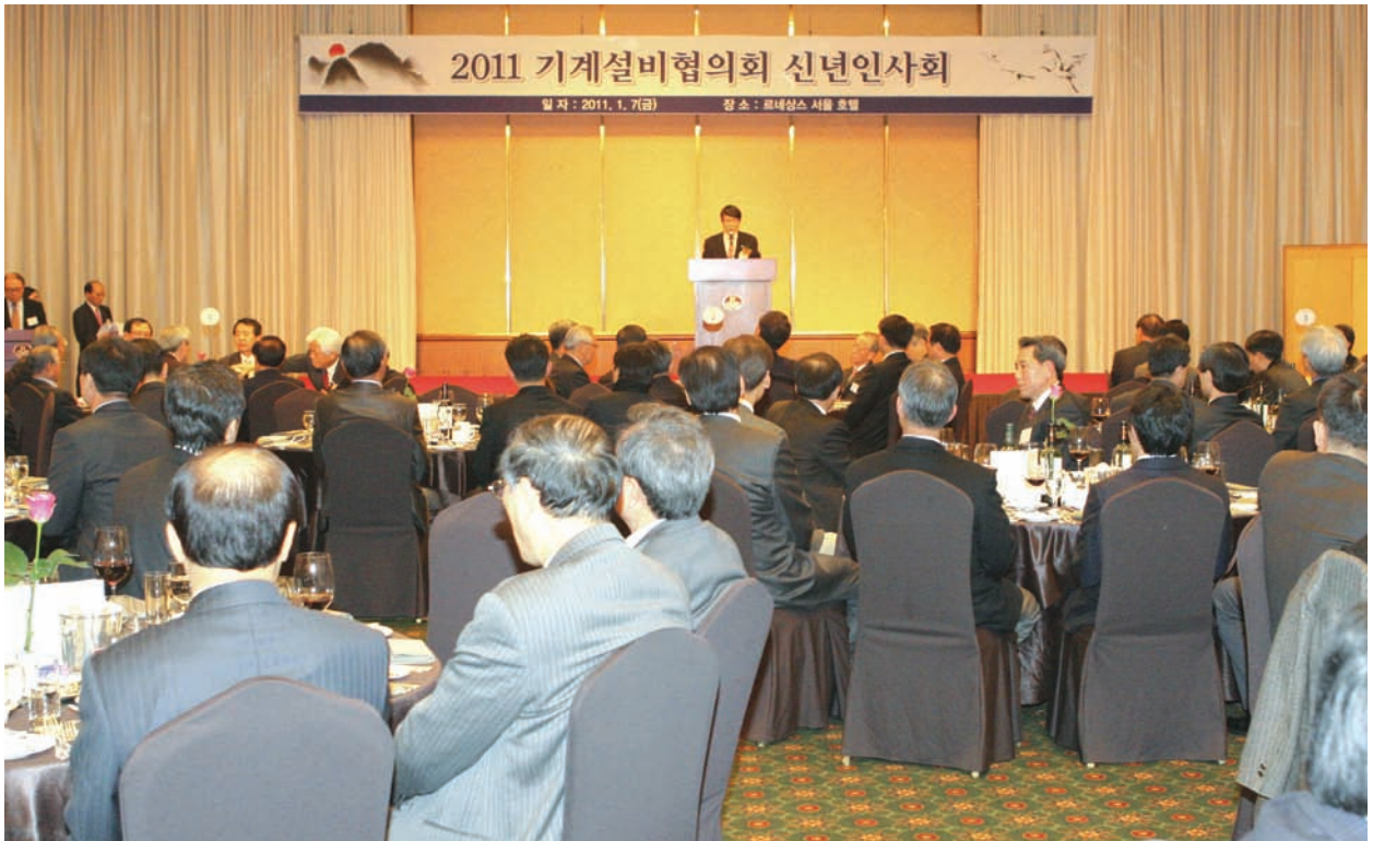
▲ 기계설비협의회는 지난 1월 7일 르네상스 서울호텔 다이아몬드볼룸에서 2011 기계설비협의회 신년인사회를 개최했다.