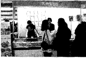
저 진행했던 HIT500 무료체험 시식행사단님들의 활기

리의 효능을 많은 고객들에게 널리 알렸으며 더욱 친숙하게 다가가는 계기가 됐다. 아울러 먼