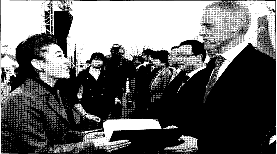
[그림 7] 울산 제4회 그린스타트전국대회

늄 포일, 폴리에틸렌으로 구성되어 있다. 국내에서는 주로 종이 포장재의 종이 즉 펄프를 가지고 화장지 제품으로 재활용이 되고 있는데, 최근에는 각종 원자재 가격의 상승으로 인하여 세계 각국에서 포장재에서 펄프를 제외한 잔유물(알루미늄 포일 및 폴리에틸렌)에서 알루미늄 포일과 폴리에틸렌을 별도 분리하여 각각의 원자재로 재활용 되는 연구가 활발히 진행되고 있다. 국내에서도 유사한 사례로 잔유물에서 알루미늄만 별도로 분리하여 순도 97% 이상의 알루미늄을 만들어 내는 연구가 거의 완료단계에 와 있다.