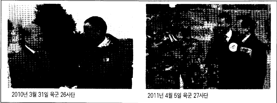
2010년 3월 31일 육군 26사단