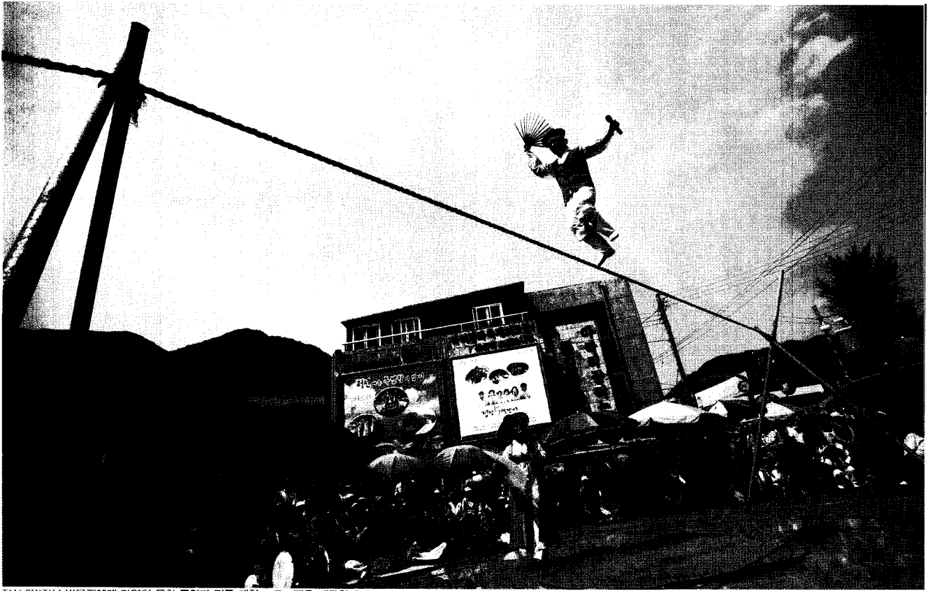
정선 5일장은 방문객에게 다양한 문화 공연과 전통 체험 프로그램을 제공한다.