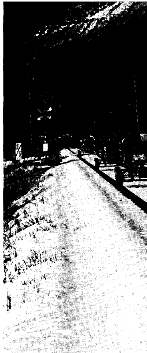
1. 하얀 눈이 쌓인 철로를 따라 달리는 짜릿한 추억. 2. 그곳의 풍경만큼은 시원스럽고 장쾌하다. 3. 정선을 들렀던 수많은 묵객들의 체취가 남아 있는 곳이다.

레일바이크의 또 다른 재미는 출·도착 지점에 있는 이색 카페다. 출발지인 구절리역 여치 카페에서 커피 한 잔 마시고 출발하면 종착역인 아우라지역에서 어름치 카페를 만날 수 있다. 이색 카페는 관광객들에게 특히 인기가