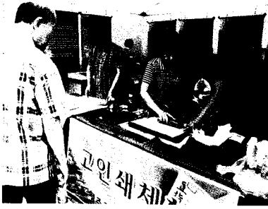
제6회 서울인쇄대상 및 인쇄문화축제