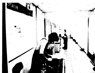
찾아가는 직지와 고인쇄문화기획 특별전 -광주-