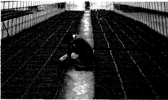
그림 2. 온실 파종 상자에 파종한 백합나무

■ 파종은 2월 초순에 실시하며, 일반상토 또는 바이오, 파워믹스, 에버그린 등의 상토를 이용하는 것이 좋다. 파종량은 ㎡ 당 50g을 흩어 뿌리며, 비 가림 하우스에서 4월 중하순까지 생육시킨다. 관수 등의 방법은 일반 노지 양묘와 동일하게 실시한다.