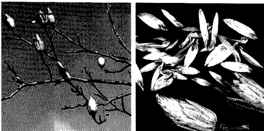
그림 1. 백합나무 종자

■ 정선하여 건조된 종자는 두꺼운 비닐팩 또는 플라스틱 용기에 넣어서 2~4℃에 저장하거나 습사와 혼합하여 노천매장 또는 0~3℃에 냉장 저장한다.