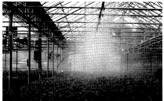
그림 5. 스프링 콜러를 이용한 자동 관수

■ 관수는 주 4회 정도, m 2 당 20ℓ 정도로 충분히 관수되도록 생육단계 및 시기 등에 따라 수분 요구량이 다르므로 적절하게 조절하여야 한다. 상토와 용기의 종류, 온실의 위치 및 환기조건, 온도, 햇볕, 바람 등 기상환경 조건에 따라 수도 관수량 및 횟수는 가감되어야 하며, 특히 상토의 종류와 수중에 따라서도 관수량을 적절히 조절하여야 한다. 용기묘의 성장량에 따라 관수 횟수를 증가하여야 하며, 생장이 왕성한 7월 이후에는 매일 관수를 실시하여야 한다.