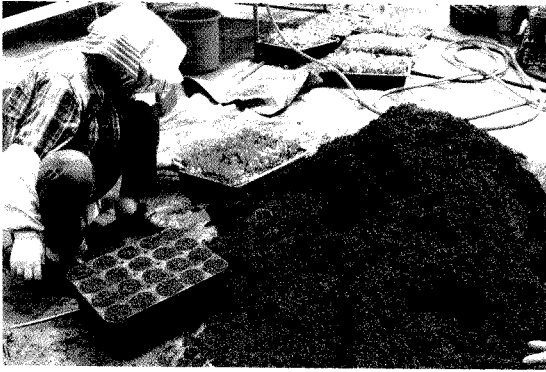
그림 3. 상토 채우기