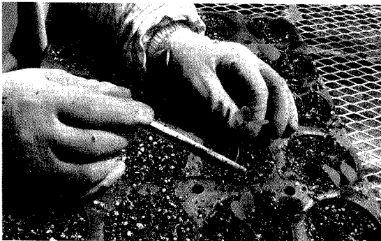
그림 4. 백합나무 이식 작업

■ 이식 초기에 습한 온실 내에서의 병충해 발생을 예방하기 위하여 살균제인 다찌가렌 1,000배액을 1개 월간(1회/주) 충분히 살포한다.