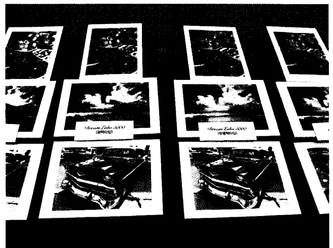
단면/양면, 광택/반광택 등 용지선택이 다양한 포토앨범, 포토 캘린더, 콜라주, 포토카드, 연하장 등 다양한 사진 상품을 인쇄할 수 있다.

한편 캐논코리아 비즈니스 솔루션은 지난 9월 28일부터 10월 1일까지 고양시 킨텍스에서 열린 제 18회 국제인쇄산업전시회에서 드림라보 5000이외에도 사진을 손쉽게 출력할 수 있는 가정용 프린터, 소비자 요구에 대응하는 고화질 프로용 프린터 및 대형 프린터, 디지털 복합기까지 다양한 제품을 전시했다. ☉