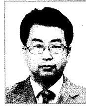
이 상 실