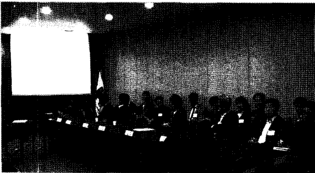
2011년 3차 이사회 활동 보고