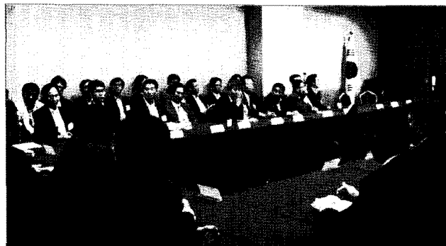
2011년 3차 이사회 토의 전경