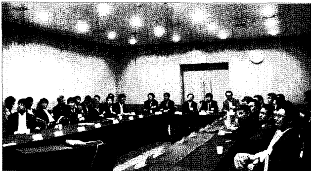
2011년 3차 이사회 전경