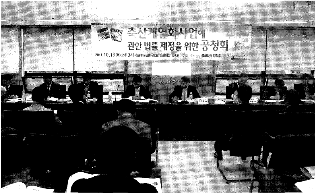
지난 10월 13일 국회의원회관에서 축산계열화사업에 관한 법률 제정을 위한 공청회가 열렸다.