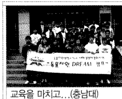
교육을 마치고... (충남대)

축산물품질평가원은 경영 선진화의 일환으로 노사발전위원회 구성 및 운영, 경영현안 해결을 위한 지역순회 설명회, 노사 파트너십 강화를 위한 노사 공동 교육참여 등을 통해 2010년 「노사상생 양보교섭 실천기업」인증 및 표창(노동부), 「작업장 혁신 우수기업」인증(노동부)을 받아 2011년 공공기관 선진화 워크숍에서 노사관계선진화 우수사례 기관으로 선정되었다. 또한 사회공헌활동의 일환으로 1社1村운동에 참여하며 1지원1후원 체제를 마련하고, 전 직원의 자율적 임금반납과 급여우수리제도를 통해 사회공헌기금을 설치·운용하며 공정한 사회를 위한 사회적 책임활동 강화를 위해 노력하고 있다.