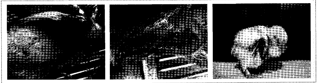
〈그림 1〉 닭 전염성 빈혈증