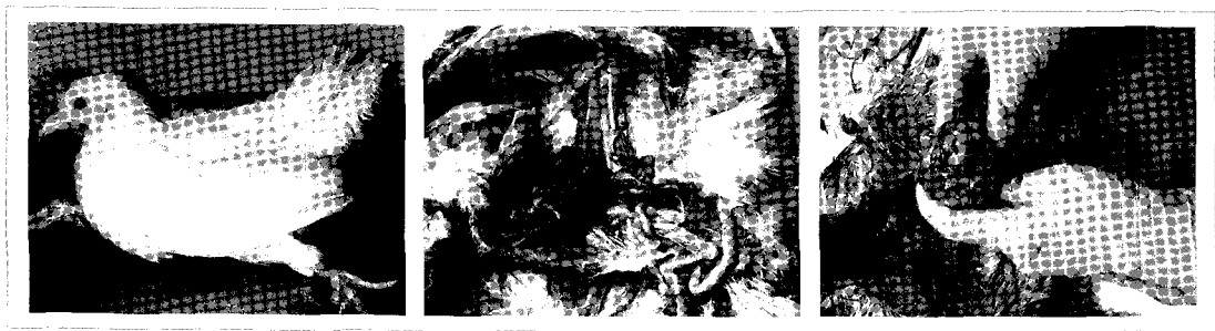
〈그림 4〉 마렉병

두 번째로 외부감염시 피해를 최소화하기 위해 사용한 백신이 오히려 독이 되는 경우를 많이 볼 수 있다.