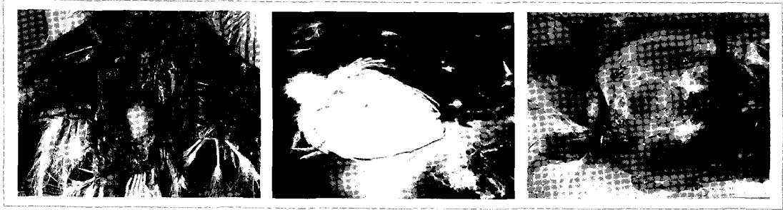
〈그림 3〉 감보로병