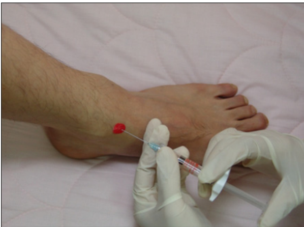
Figure 2. Injection point of hyaluronic acid.

족관절 주사는 방사선 기계 도움 없이 비교적 쉽게 행할 수 있다. 즉, 환자를 양와위에 두고 무릎을 굽혀 발을 바닥에 위치시키면 족관절 전면이 개방된다. 이때 검사자의 손가락으로 주사하고자 하는 내과 또는 외과의 가장 근위부 내측을 촉지하여 주사하면 된다(Fig. 2). 만일 삼출액으로