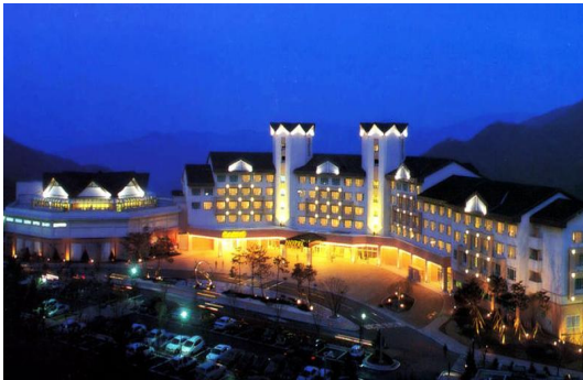
그림 1. 강원랜드의 카지노장 Fig. 1 A Casino place of Gwangwonland