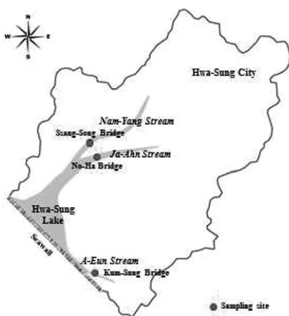
Figure 1. Map of sampling site at inflow streams of Hwa-Sung Lake

Table 1은 조사대상인 화성호 유입하천 유역의 토지이용현황을 나타낸 것으로 도시는 도로, 대지, 학교용지, 주차장, 주유소 등을 포함하며, 농경지는 논과 밭으로 구성된다. 또한 산림지역은 숲이 우거진 임야를 나타내고, 기타는 과수원, 제방, 하천, 공원, 체육용지, 종교용지, 잡종지 등을 포함하여 나