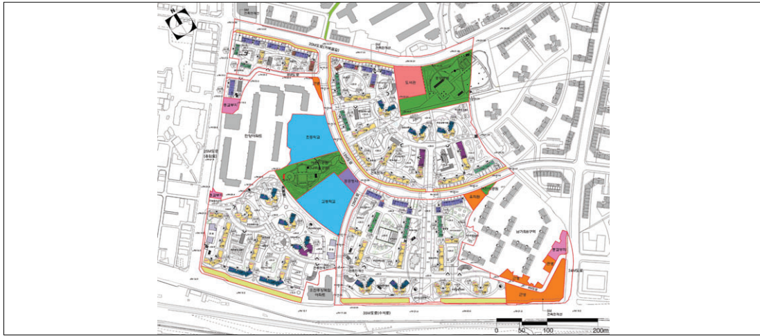
그림 2. 연구대상지역의 토지이용계획