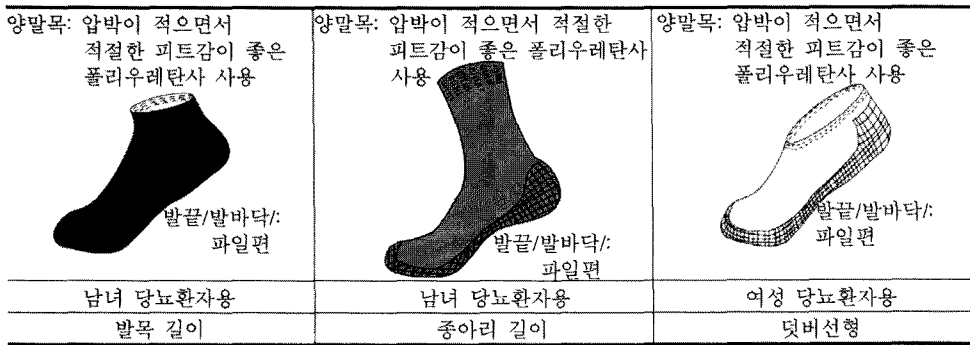
<그림 2> 당뇨병 환자용 무슬기 양말 설계방안