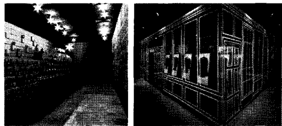
<그림 1> 판지를 이용한 공간

이를 통해 재료는 공간의 배경이 아니라 새로운 디자인적 요소로 부각됨으로 이미지를 창출해내는 도구로서의 역할을 하고 있다. 즉, 재료 자체가 차별적인 디자인을 만들어내는 중요한 요소라고 할 수 있다. 4)