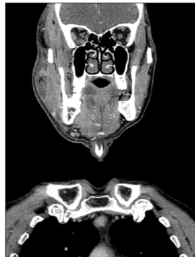
Fig. 2. CT view shows infra temporal, buccal, parapharyngeal space abscess.

입원 당일 혈압 130/70 mmHg, 맥박 84회/분, 호흡수 20회/