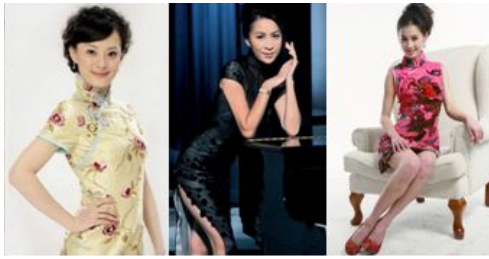
〈그림 4〉 중국 연예인들의 치파오 스타일.