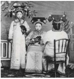
<그림 2> 청조(清朝) 만주족(滿洲族) 여성 복식.