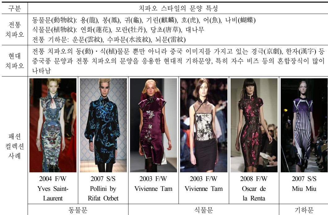
<표 7> 현대 패션 컬렉션에 나타난 치파오 스타일의 문양 특성

치파오 디자인의 문양을 살펴보면 중국 전통 대표적인 동·식물 문양뿐만 아니라 중국 이미지가 느껴지는 그림이나 경극 얼굴 분장도 사용하였다. 중국 전통 문양을 쓰더라도 단순히 그냥 사용하는 것이 아니고 현대적으로 변형시켰다. 현대 치파오 디자인에 나타난 동물 문양 중에는 용문(龍紋)과 봉황문(鳳凰紋)이 많았으며, 식물 문양 중에는 화문(花紋)과 대나무 많이 사용되었으며, 자수나 비즈의 장식을 혼용하여 화려하게 표현되기도 하였다. 현대적 기하문과 한자(漢字) 문양 등 중국풍 문양도 현대 치파오 디자인에 많이 사용되며, 현대적인 기법으로 만들어진 동양 이미지의 문양도 응용된 사례가 많았다(표 7).