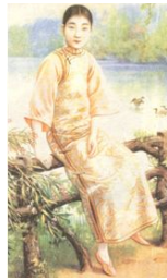
<그림 3> 1920년대 마갑(馬夾) 치파오.

유럽계 원하는 대로 의상을 만들어 입을 수 있게 되었고 복식의 유행이 생겨났다. 이러한 복식의 대중화·보편화뿐만 아니라 전통적인 의상에 있어 서구의 복식양식이 유행하며 전통문화 깊숙이 파고 들기 시작하였다.