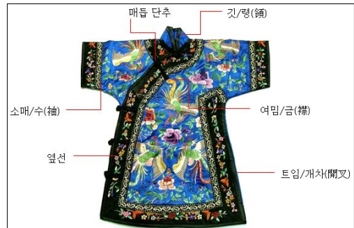
<그림 1> 치파오의 구성 및 부분 명칭.

‘치파오’라는 용어가 처음 문헌으로 기록된 것은 청나라 때이다. 그러나 그 시기에 기록된 치파오는 지금 우리가 논하고 있는 현대의 치파오와 많은 차이점이 있어서 일부 학자들은 현재의 치파오는 청나라 때의 치파오가 아니라고 주장하기도 한다. 미국에서 현대화된 치파오를 지칭하는 차이니즈 드레스(Chinese Dress)의 유행과 함께 등장한 이름이다. 현재 우리가 보편적으로 인식하고 있는 치파오