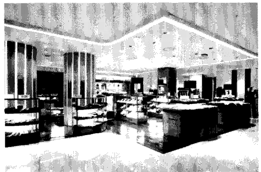
6층 남성 컬렉션

8층 - 전혀 다른 성격의 매장인 아동과 스포츠매장이 함께 있으므로, 각자의 성격과 특성에 따라 고객의 시선을 분리할 수 있도록 조명설계를 특색화했다. 아동매장은 건축요소와 부합하여 유기적인 곡선과 형태를 강조해 부드러우면서도 리드미컬한 느낌을 부각하였고, 스포츠 매장은 적절한 휘도 도입으로 활동적이고 적극적인 분위기를 연출하였다.