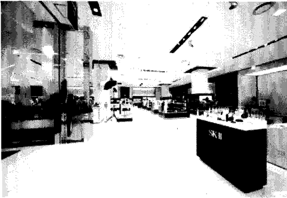
1층 매장 전경