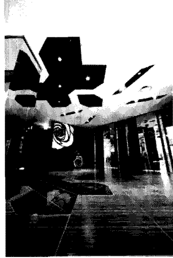
2층 메인 엘리베이터홀

& white의 깔끔한 기구의 마감처리로 세련된 남성적 감성을 강조하였다.