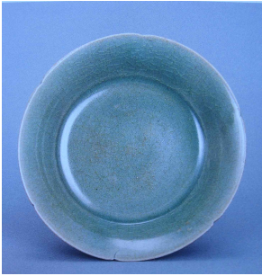
<그림 7> 필리핀 출토 고려청자

필리핀에서 출토된 조선시대의 도자기로는 15세기에 제작된 인화기법의 분청사기가 있다. 동종의 도자가 하카타(博多) 유적 등 일본 서부지역에서 출토되고 있어 일본 서부에 전해진 분청사기의 일부가 오키나와를 거쳐 필리핀 지역으로 반입된 것으로 여겨진다.