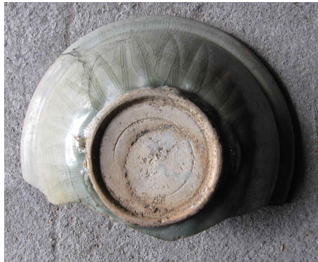
<그림 10> 베이어컬렉션 소장 타이청자