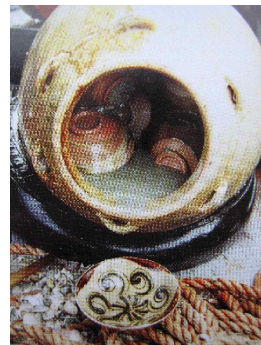
<그림 2> 인도네시아 벨리통 출토 장사요청자(826년경)

이러한 장사동관요는 한국과 일본 그리고 베트남, 필리핀, 인도네시아를 거쳐 이란 등 서아시아지역까지 수출되어 무역도자기로 당대도자기의 존재 및 무역루트를 보다 명확하게 제시하고 있다.