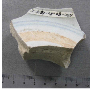
<그림 8> 필리핀 인트라무로스 출토 일본 청화백자