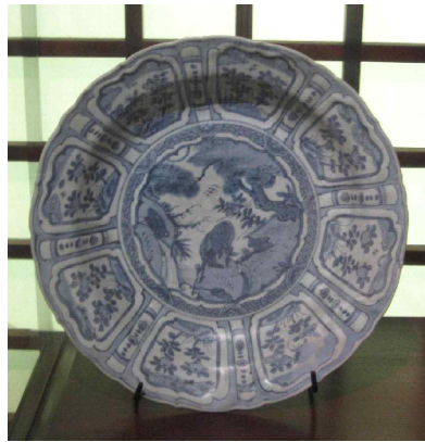
<그림 6> 샌디에고 침몰선 출토 반 (1600년경)