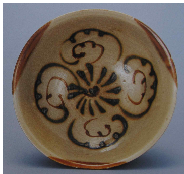
<그림 1> 필리핀 출토 장사요청자

필리핀 유적에서 출토된 중국도자기는 당대(唐代), 송대(宋代), 원대(元代), 명대(明代), 청대(清代)로 구분할 수 있다. 당대도자기는 장사요청자(長沙窯靑磁), 월주요청자, 형요백자(邢窯白磁) 등이 있다. 장사요청자는 대부분이 접시로 형태와 문양이 인도네시아 벨리통(Belitung, 826년경 침몰)에서 출토된 것과 동일하여 늦어도 826년경에 필리핀 지역에 반입된 것으로 여겨진다. 접시의 중앙에는 초화문이 커다랗게 장식되었고 세 귀통이에는 산화철로 세 귀통이를 직선으로 색칠하여 소박하면서 과감한 문양을 만들어내고 있다. (그림 1, 2)