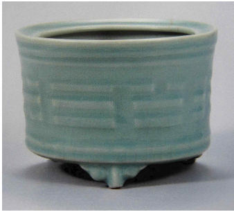
<그림 3> 필리핀 출토 용천요청자 향로

원대도자기는 절강성 용천요(龍泉窯)청자와 강서성 경덕진요(景德鎮窯)에서 제작된 청백자와 청화백자가 있다. 용천요청자는 대형의 반(盤)과 향로(香爐)등이 중심을 이루고 있다. 반의 중앙에는 물고기 두마리가 서로 마주보고 헤엄치는 모습이 시문되어있다. 그리고 향로에는 원의 도자기에서 보이기 시작하는 팔괘(八卦)의 문양이 시문되어있다.(그림3) 이 문양은 기본적으로 조상의 은덕을 기리고, 혼란한 현세를 우주의 원리와 질서를 도형화한 팔괘를 통해 굳굳이 헤쳐 나가려고 했던 당시 사람들의 모습을 헤아릴 수 있다.