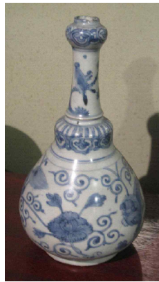
<그림 5> 샌디에고 침몰선 출토 청화백자병 (1600년경)

필리핀 유적에서 나온 청대도자기는 스페인 유적인 인트라무로스에서 폭넓게 출토되고 17세기 후반의 청화백자와 색회자기가 대부분을 차지하고 있다. 출토된 청대의 도자기는 경덕진, 복건, 광둥지역 등에서 주로 제작되었다.