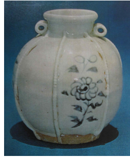
<그림 4> 필리핀 산타아나 유적 출토 청화백자

필리핀 출토의 원대도자기는 대부분이 14세기 전반의 것이고 기형과 문양 등이 한국新安(新安) 앞 바다 침몰선에서 나온 중국도자기의 매우 흡사하여 14세기 전반의 중국의 청자 및 경덕진의 청백자의 연구에 매우 중요하다.