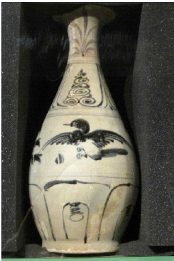
<그림 9> 판다난 (Pandanan) 침몰선 출토 베트남청화백자