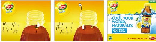
그림 5. Lipton