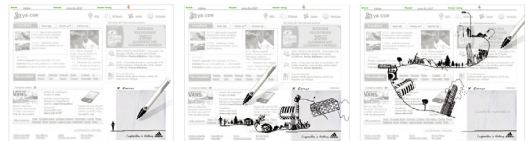
그림 4. Adidas

아디다스 배너광고는 마우스의 움직임에 따라 건물, 나무, 산과 들이 그래픽 요소로 나타나고, 그 움직임에 따라 운동하는 사람이 끊임없이 따라온다. 배너광고에 나타난 유머 표현 유형은 과장, 변신, 이탈, 의외, 놀이, 비현실적 표현이다. 건물, 나무, 산과 들 등 아디다스 배너광고에 나타난 그래픽적인 요소는 상상력을 더욱 극대화하고, 비현실적인 이탈과 변신은 의외적 요소가 됐으며 과장된 사물들의 나타남은 광고의 의도를 더욱 강하게 전달하고 있다.