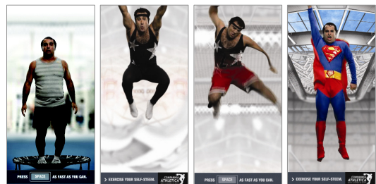
그림 1. CIA Athletica

[그림 1]의 시작은 트럼프 운동기구에 한 남자가 서 있고 키보드의 스페이스 바를 클릭하면 서서히 위로 튀기 시작한다. 스페이스 바를 빨리 클릭하면 서서히 격한 운동장면으로 변하고 나중에는 슈퍼맨으로 변신한다. 이 사례에서 나타난 유머 표현 유형은 과장, 변신, 의외, 놀이, 비현실이다. 웃음을 자아내게 하는 과장과 변신은 흥미를 유발하고 있으며 또한 색다른 변화로서 주장하려는 의도를 더욱 강하게 하고 있다. 변화하는 운동복과 운동경기는 의외적 요소를 담고 있으며 또한 비현실적 표현으로 코믹함과 상상력을 극대화하고 새롭고 신선하게 흥미를 유발하고 있다.