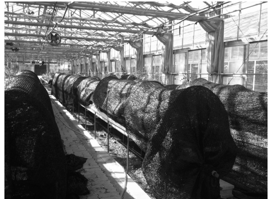
Fig. 3. View of experiment for shading treatment.

로 무차광처리구 41.9에 비하여 증가하였으나 30%, 80% 처리구 에서는 오히려 각각 36.7, 33.9로 감소하는 경향을 보여 Han(2001) 등에 의한 실험결과 보고와 같이 50% 차광처리구에서는 같은 결과이었으나 기타 처리구는 상이한 결과를 보여 식물에 따라 다른 결과가 있는 것으로 사료된다. 또한 전광조건에서 산마늘과 같이 내음성을 지닌 음지성 식물은 양지성 식물에 비해 광화효율이 낮다(Kitao 등, 2003)는 결과와 50% 처리구에서는 같은 경향을 보였으나 30%, 80% 처리구에서는 오히려 광합성효율이 각각 36.7, 33.9로 떨어져 엽록소 함량이 낮은 것으로 보였다.