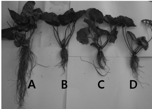
Fig. 1. Difference of Ligularia stenocephala growth according to shading levels. A: control, B: 30% shading, C: 50% shading, D: 80% shading.

위의 생체중은 Table 4와 같았다. 차광처리별로 각각 30% 차광 31.63g, 50% 차광 43.39g, 80% 차광 19.40g로 무처리구 90.43g에 비하여 오히려 효과적이지 못했다. 무차광재배시 생체중은 증가를 하였으나 엽수의 양은 오히려 감소를 하여 식용으로 사용할 경우 수확량이 적을 뿐만 아니라 생육상태는 엽록소의 양의 감소로 인해서인지 엽색이 선명하지 않았으나(Fig. 1) 뿌리의 생육상태를 보았을때 척박지의 대면적지 토양이나 비탈면의 토양 표면 침식지의 방지에 사용이 가능하리라 생각이되어 보다 더 많은 실험이 요구된다.